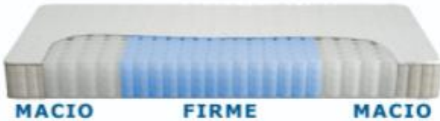
Ilustração do Molejo